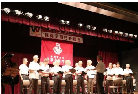
シャウティン グ フォックス

第二部の市民公開のイベントには、会員に加え、大学や近隣稲門会の来賓（11名）と市民が参加し、180席の会場はほぼ満席となった。前半は、白山中学・我孫子中学合同合唱部、後半は、男性合唱団シャウティン グ フォックスによる合唱団演奏会を行った。（演奏会の内容は、「合唱団演奏会」を聴いてに掲載）