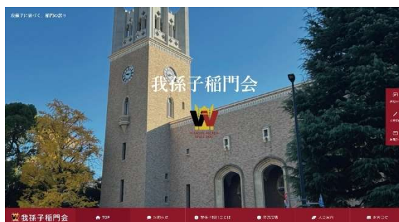
HP トップ画面（切り替わります！）